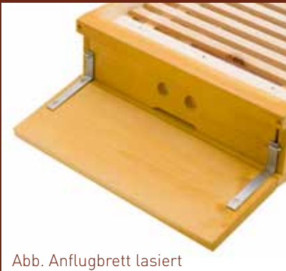
Abb. Anflugbrett lasiert